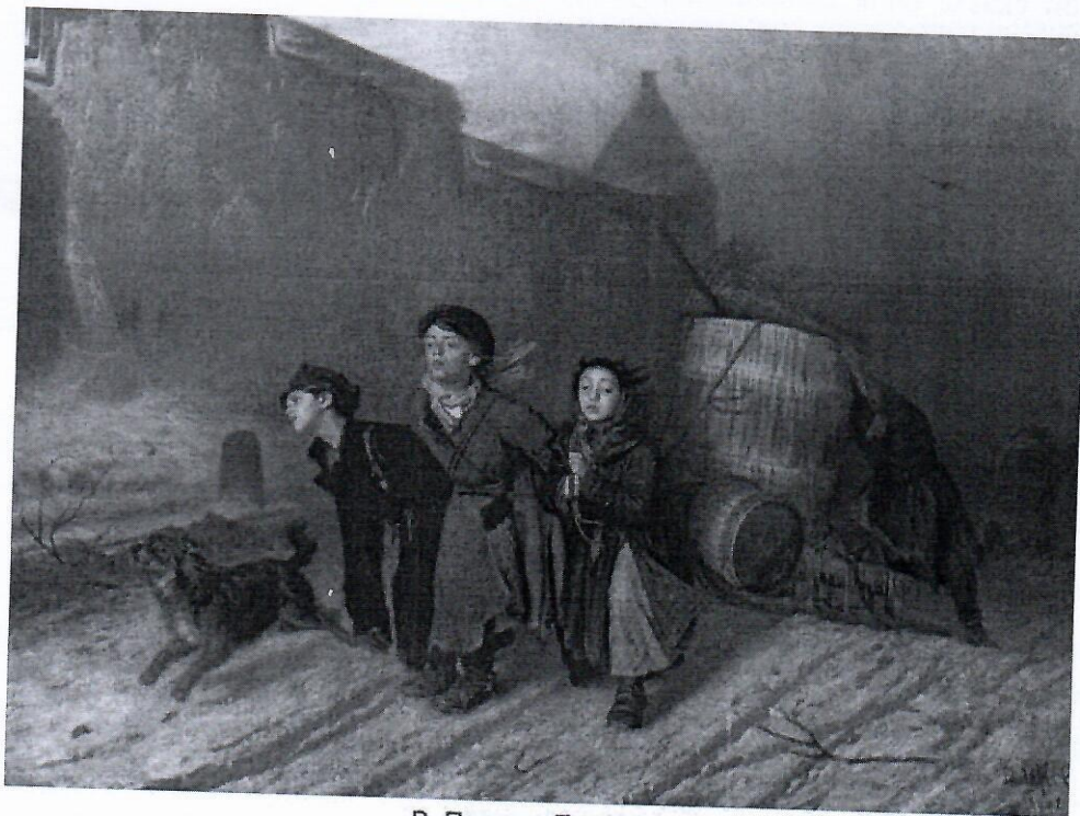
В. Перов. «Тройка»

Задание 9. Рассмотрите иллюстрацию картины В. Перова «Тройка». Всего за задание – 5 баллов.