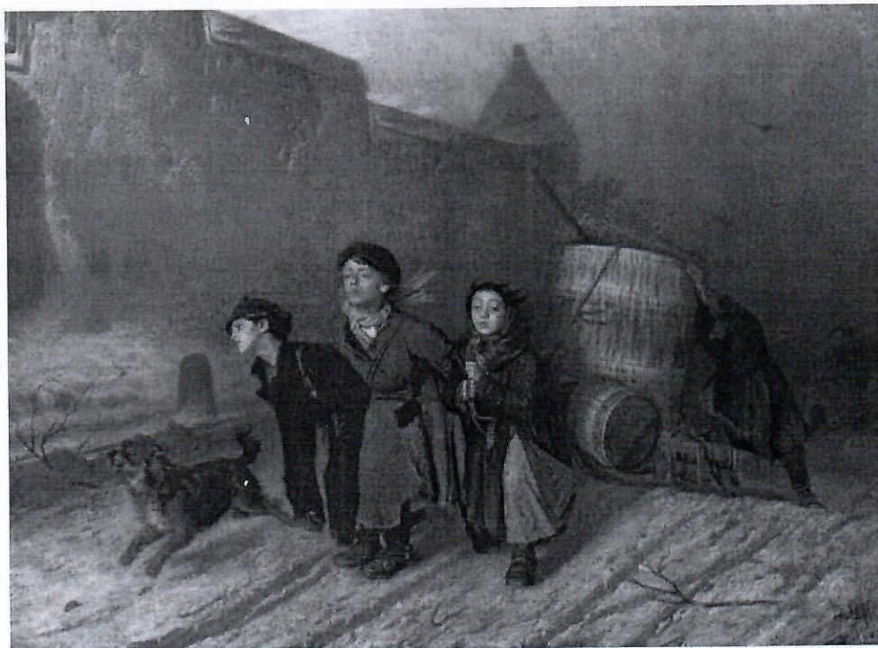
В. Перов. «Тройка»

Выберите из предложенных статей Конвенции о правах ребёнка ту статью, которая нарушена. Ответ укажите цифрой.